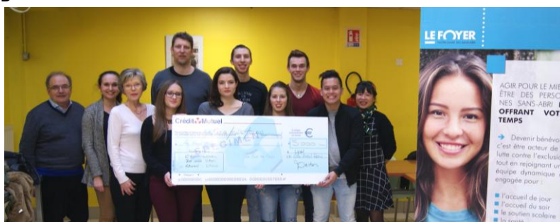
REMISE DE CHÈQUE, FRUIT DE LA SOIRÉE ORGANISÉE PAR LA COUR DES CHEFS